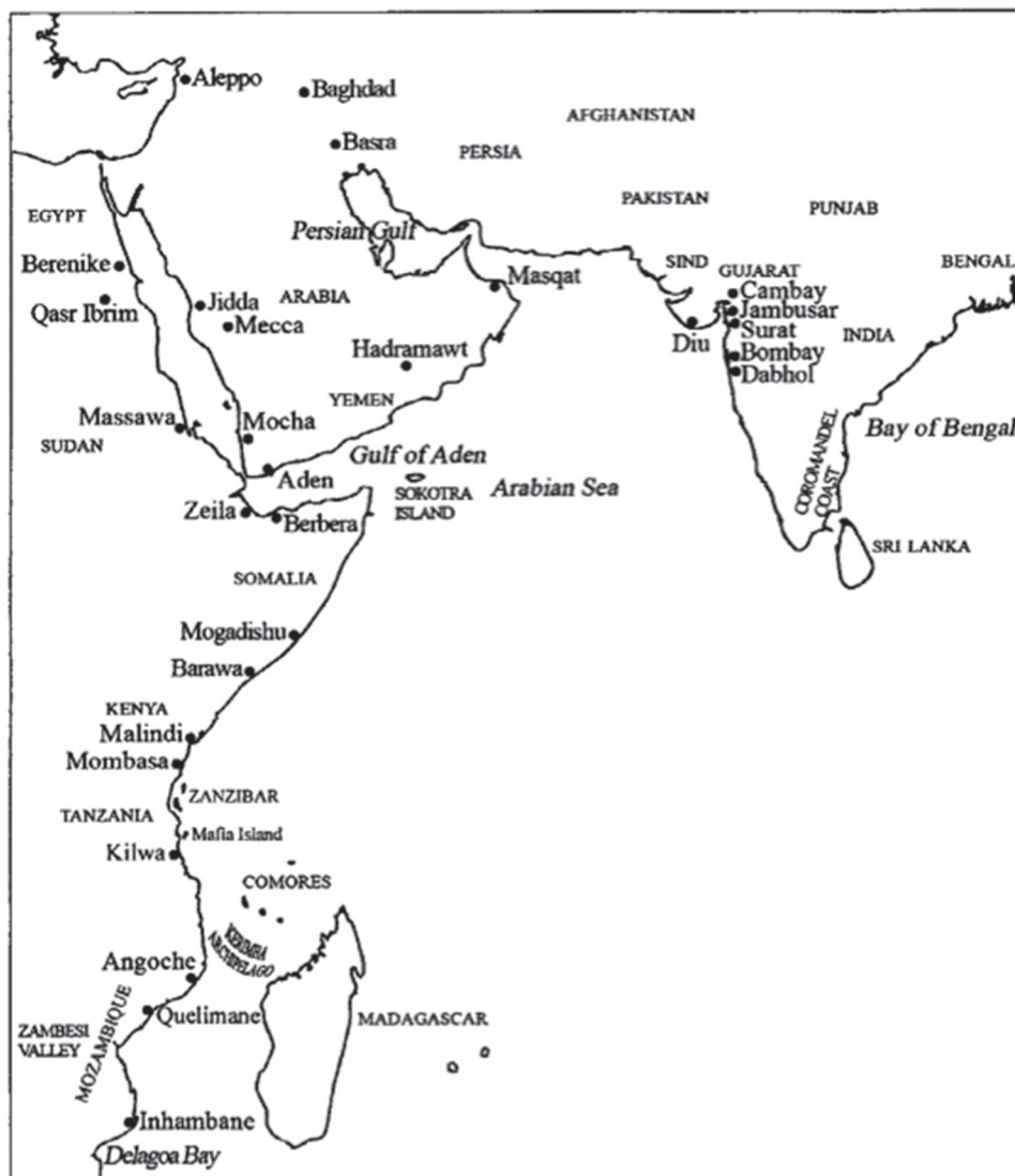
Map 8.1. Areas of cotton textile trade in the western part of the Indian Ocean